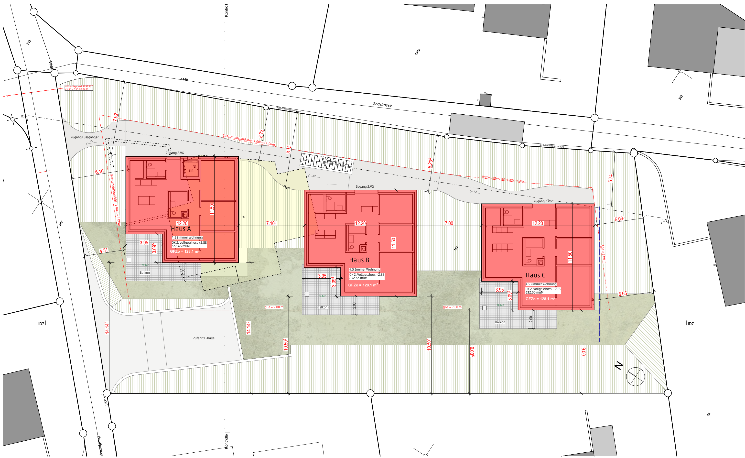
Grundriss 2. Vollgeschoss