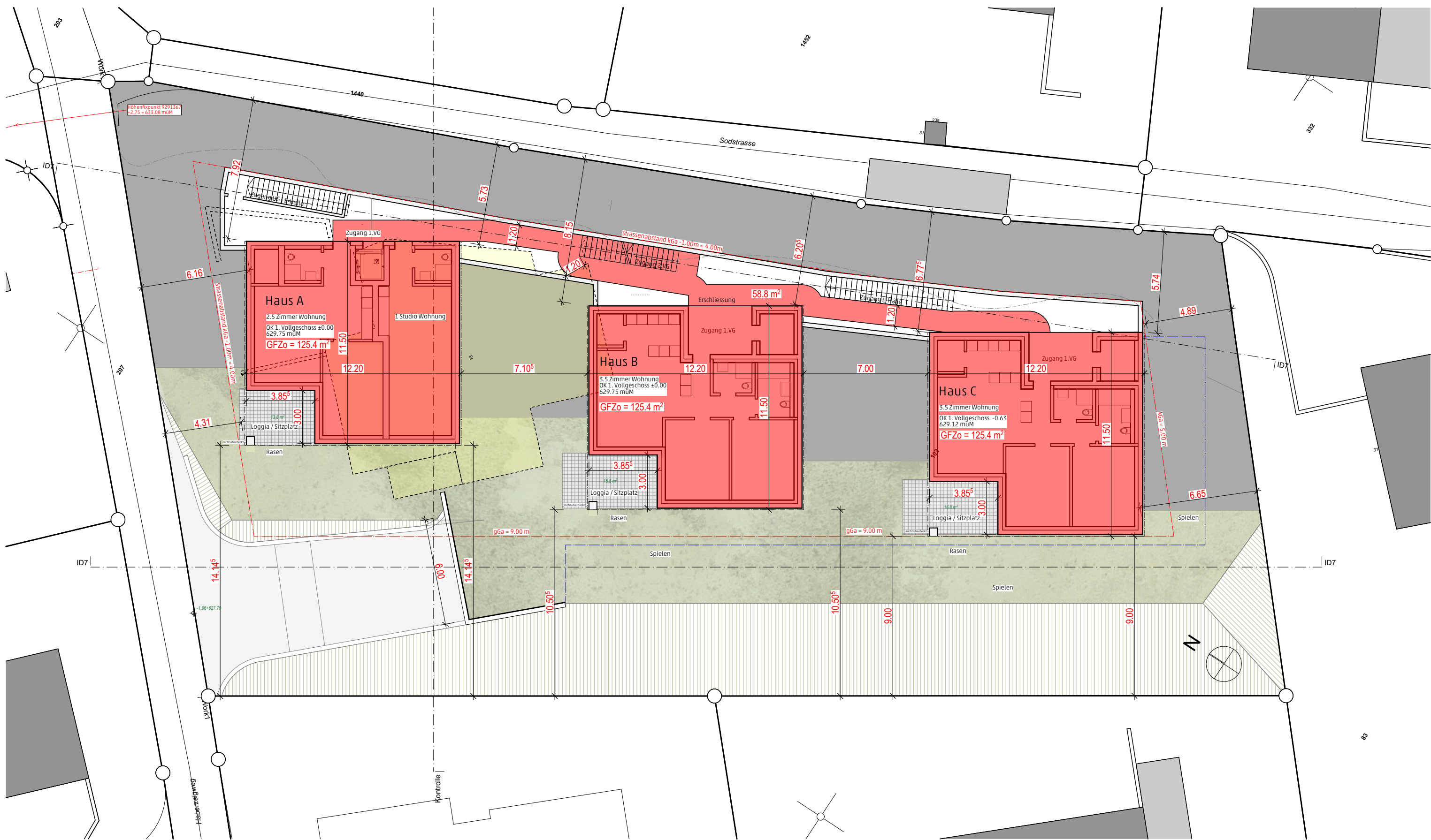
Grundriss 1. Vollgeschoss