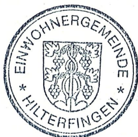
Brigitte Bähler Finanzverwalterin