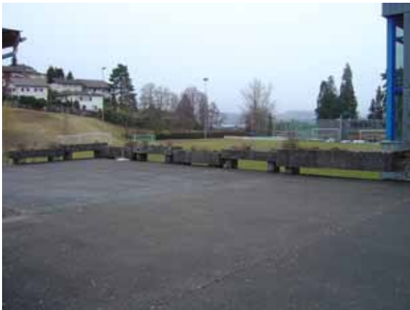
Gesamtansicht Aussenplatz Nordseite

Der Gemeinderat beantragt der Versammlung, den Kredit von Fr. 210'000.00 für die Sanierung und den teilweisen Neubau des Aussenplatzes zu genehmigen.