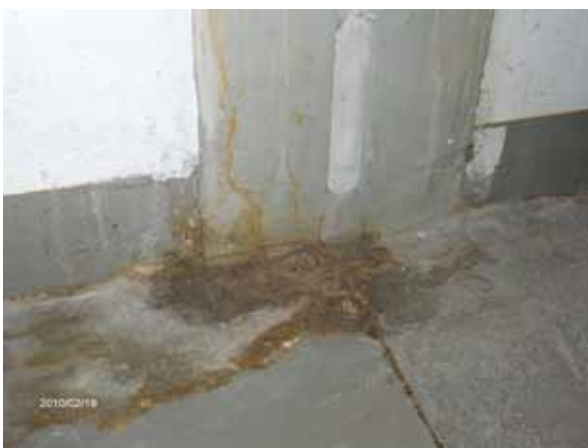
Schäden im Verbindungsgang