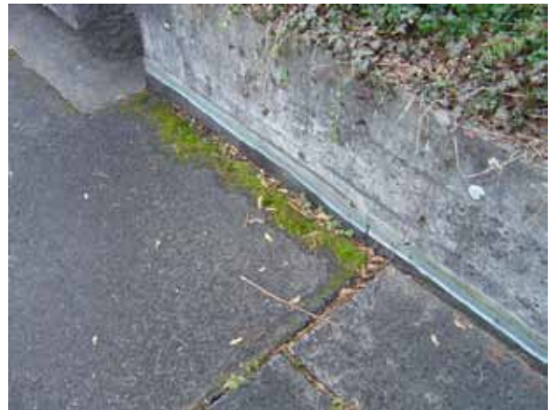
Undichte Stellen im Belag